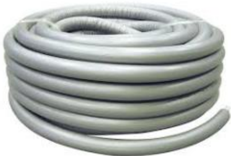
Tubo multistrato rivestito per riscaldamento